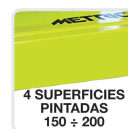
4 SUPERFICIES PINTADAS 150 ÷ 200