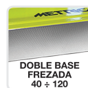
DOBLE BASE FREZADA 40 ÷ 120