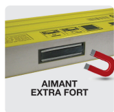
AIMANT EXTRA FORT