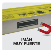
IMÁN MUY FUERTE