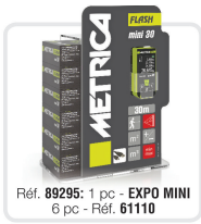
Réf. 89295: 1 pc - EXPO MINI 6 pc - Réf. 61110